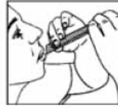
Llevar a la boca presionar y extraer

Si los síntomas empeoran o persisten después de 7 días debe consultar a su médico.