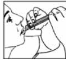
Llevar a la boca presionar y extraer

Si los síntomas empeoran o persisten después de 7 días debe consultar a su médico.